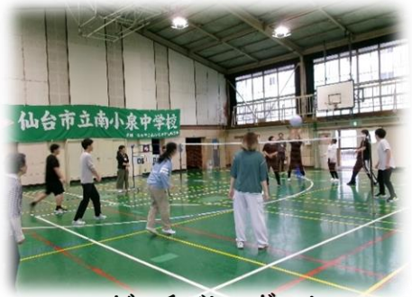
ビーチバレーボール